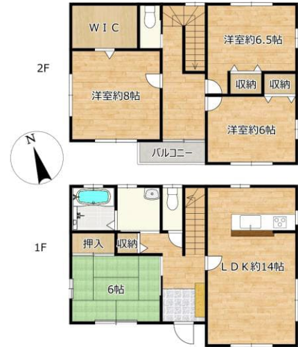
※図面と現況が異なる場合には現況を優先します。