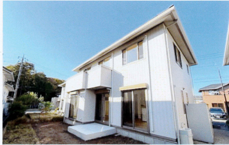
■外壁に「光触媒タイル・キラテック」を採用(2024年11月撮影)