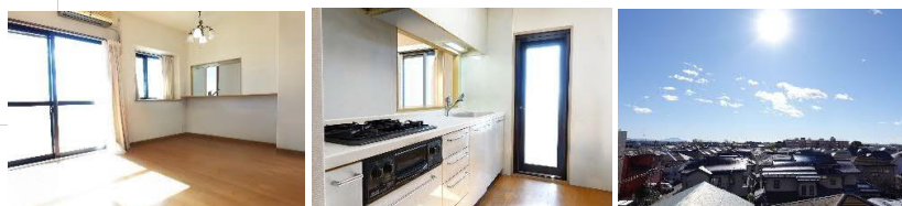
リビングダイニング 勝手口のあるキッチン 南側バルコニーからの眺望