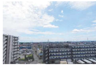
南側バルコニーから南方面の眺望