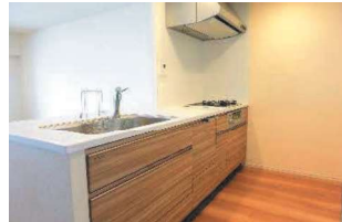
カウンターキッチン