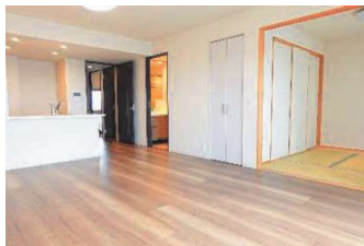
リビングダイニング・キッチン・和室