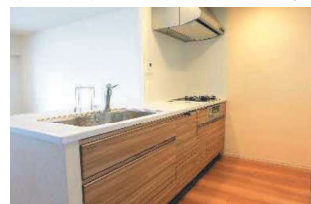
カウンターキッチン