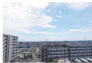
南側バルコニーから南方面の眺望