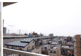
南側バルコニーからの眺望