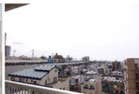
南側バルコニーからの眺望