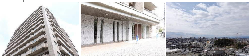
マンション外観 車寄せのあるマンション入口 南西側バルコニーからの眺望

※この図面と現況が異なる場合は現況優先となります。売却済みの場合はあしからずご了承ください。 ※賃貸中の場合、売主が賃料を保証するものではありません。 ※税込価格の場合、消費税を含む価格です。消費税率改定の際に販売価格が変更になる場合があります。詳しくは係員にお尋ねください。 ※仲介物件成約の際には規定の仲介手数料を申し受けます。仲介手数料その他諸経費に対して消費税が課税されます。間取のSは納戸です。