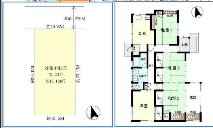
※図面と現況が異なる場合があります