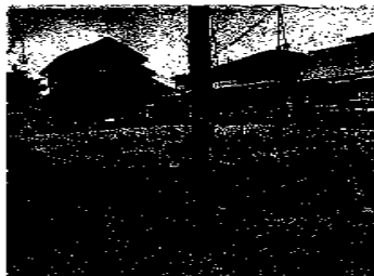
その他現地 現地(2023年5月)撮影