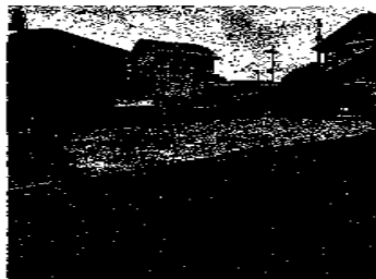
現地土地写真 現地(2023年5月)撮影