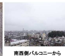
南西側バルコニーから南西方面の眺望