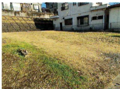
現地土地写真 現地(2024年2月)撮影