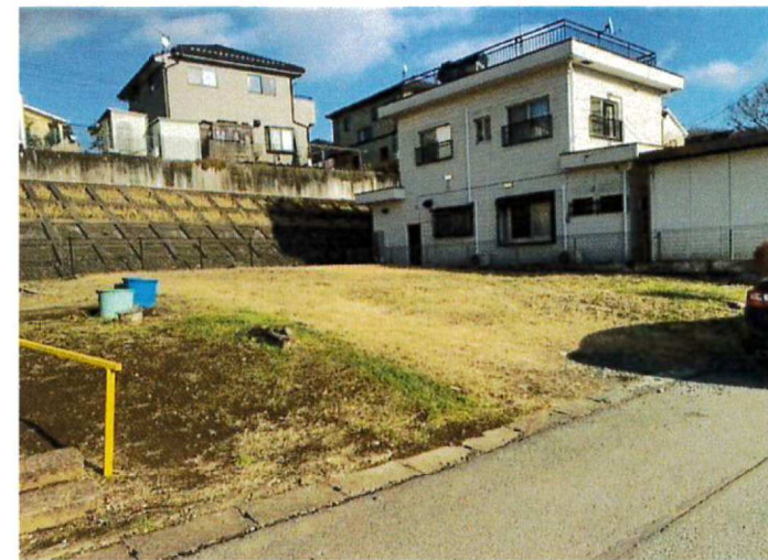
その他現地 現地(2024年2月)撮影