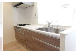
カウンターキッチン