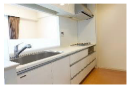
リビングダイニング・キッチンの写真は、 現況写真と間取り図面をもとにCGで作成 したリフォームイメージです。