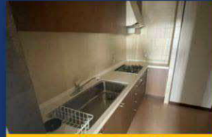
広々としたキッチン