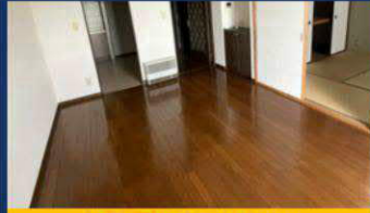
綺麗で状態の良い室内