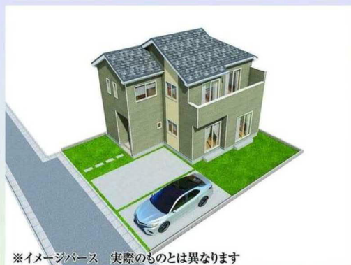
※イメージバース 実際のものとは異なります

☆人気の桜小学区です☆ ☆陽西中学校まで徒歩3分☆ ☆買い物楽々!スーパーまで徒歩5分 限定1棟の販売☆