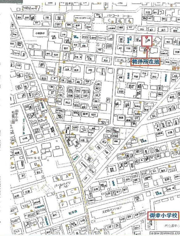
この図面は物件情報の一部を抜粋して掲載しております。(現状優先)