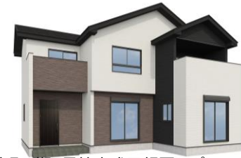
宇都宮市中岡本町7期1号棟完成予想図※パースはイメージです。