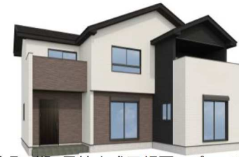
宇都宮市中岡本町7期1号棟完成予想図※パースはイメージです。