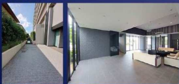
▲アプローチ ▲ロビー