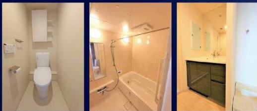
▲トイレ ▲浴室 ▲洗面化粧台