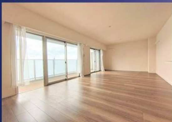
▲リビングダイニング