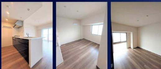
▲キッチン ▲洋室(7.0帖) ▲洋室(6.0帖)