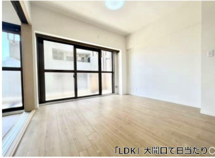
「LDK」大開口で目当たり◎