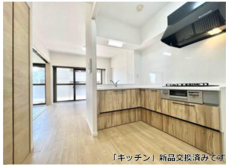
「キッチン」新品交換済みです