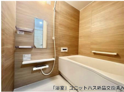
「浴室」ユニットバス新品交換済み