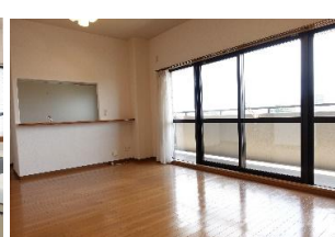
リビングダイニング