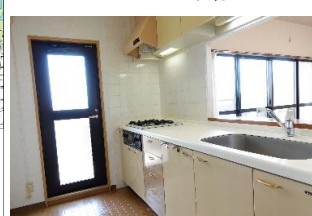
勝手口のあるキッチン