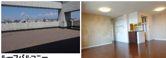
ルーフバルコニー