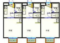
南側キャロットハイツ間取