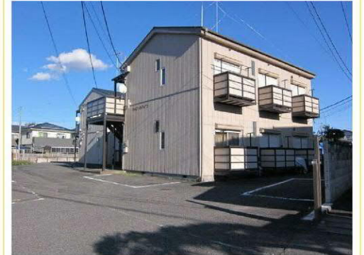
キャロットハイツ

※この図面はATBBの物件情報の一部を抜粋して掲載しております。(現況優先) ※入居日・引渡日変更や付帯条件、別途料金が発生する場合がありますのでご確認ください。