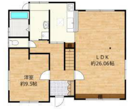
※図面と現況が異なる場合には現況を優先します。