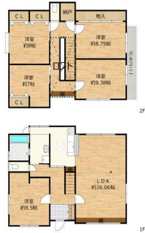
※図面と現況が異なる場合は現況を優先します。