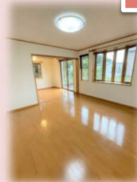
広く日当たりの良いリビングダイニング♪

☆長期優良住宅! + 太陽光発電システム搭載! ☆建物面積約42坪! ゆとりの4LDK♪ ☆全室南向きで日当たり良好♪ ☆リフォーム済みできれいな室内♪ (全室クロスメイク・畳表替・ハウスクリーニング等)