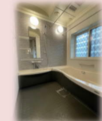
浴室暖房乾燥機付の快適な浴室♪