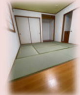
広縁付の10帖の和室♪