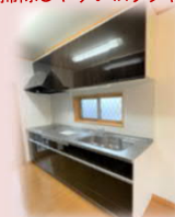
お掃除しやすいIHキッチンヒーター♪

☆長期優良住宅! + 太陽光発電システム搭載! ☆建物面積約42坪! ゆとりの4LDK♪ ☆全室南向きで日当たり良好♪ ☆リフォーム済みできれいな室内♪ (全室クロスメイク・畳表替・ハウスクリーニング等)