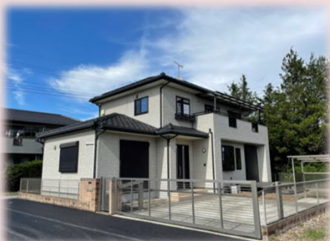
西側道路を舗装して、雨の日でも安心!