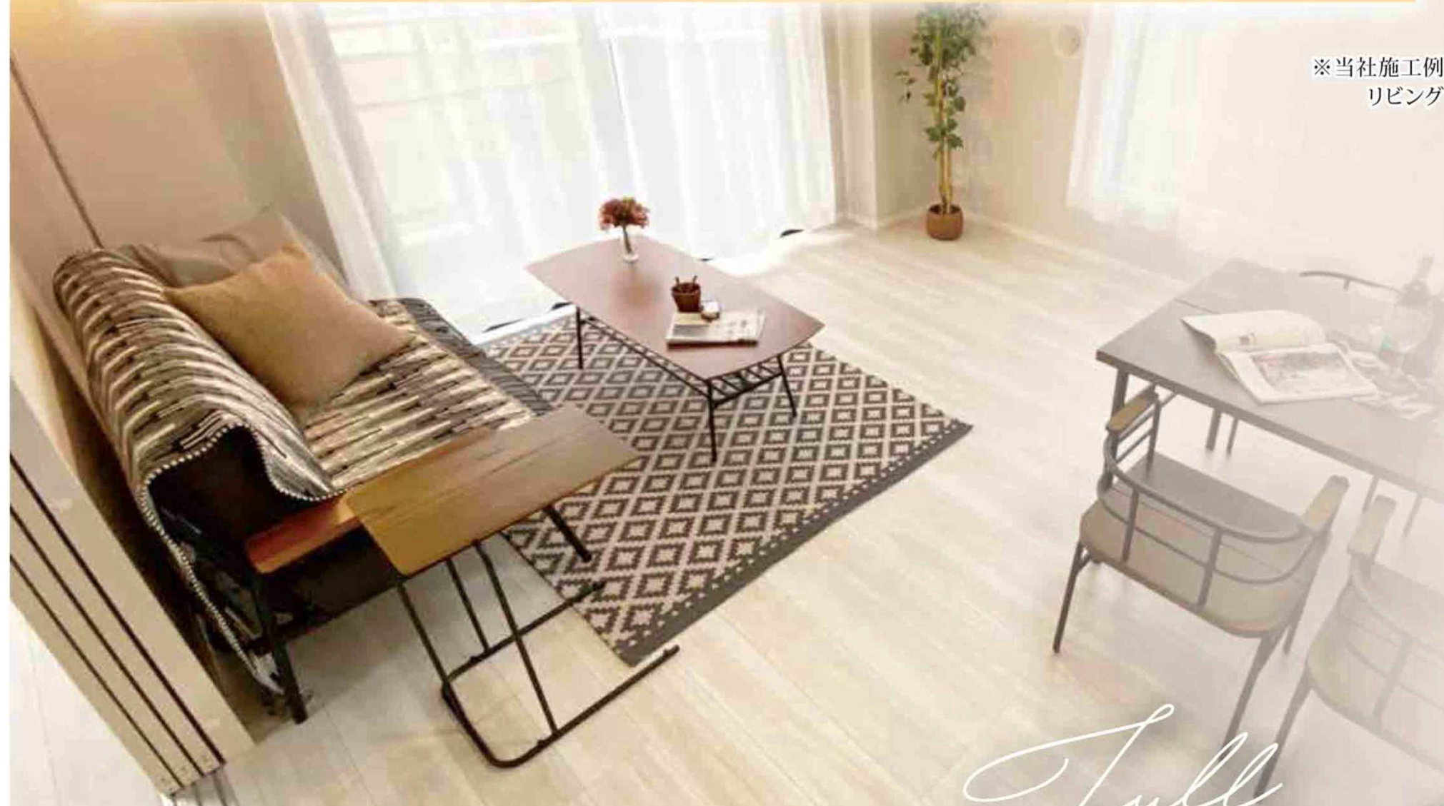
※当社施工例 リビング