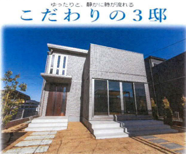
現地外観 1号棟 掲載写真2023年1月撮影