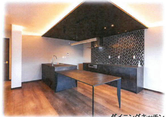
ダイニングキッチン 家事が心地よいダイニング キッチンとダイニングテーブルが一体化され、お料理の給仕や 片付けがスムーズな動線。ダイニングが主役とも言える家族の空間