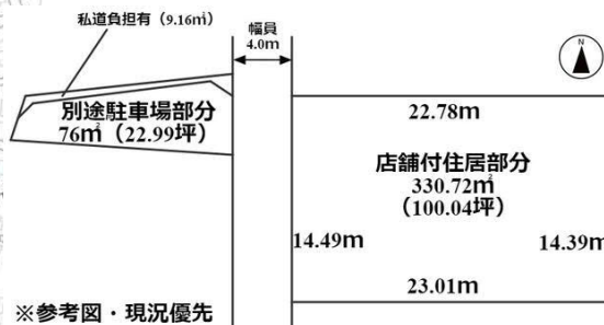
※参考図・現況優先