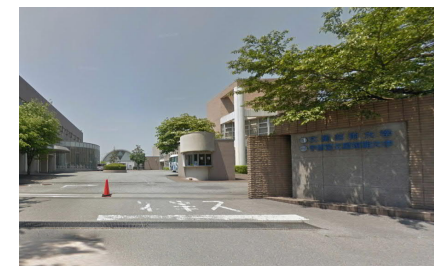
文星芸術大学キャンパス