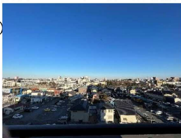
東側バルコニーからの眺望