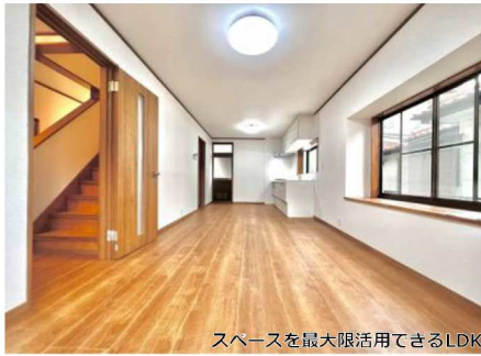
スペースを最大限活用できるLDK