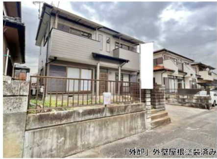
「外観」外壁屋根塗装済み