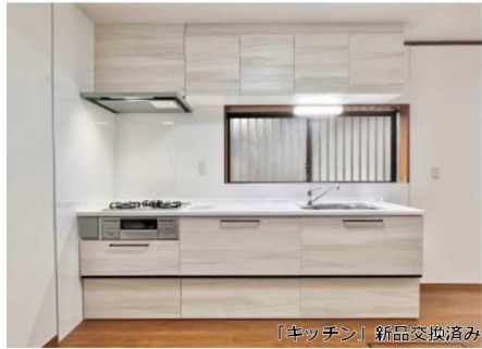
「キッチン」新品交換済み