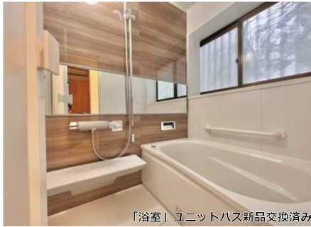
「浴室」ユニットバス新品交換済み