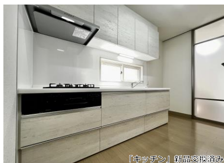
「キッチン」新品交換済み