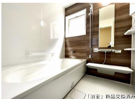
「浴室」新品交換済み