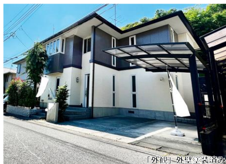
「外観」外壁塗装済み