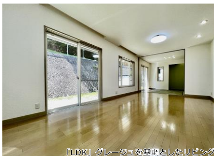
「LDK」グレーージュを基調としたリビング