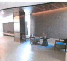
エントランスホール