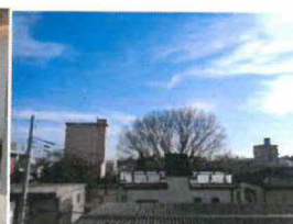
南側バルコニーからの眺望