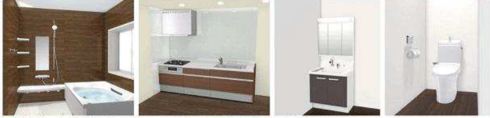
※新品交換予定のイメージ画像となります。CG合成によるイメージ画像です。実際を撮影した画像ではないため、実物と異なる場合があります。