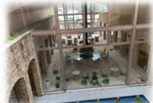
ホテルのような高級感