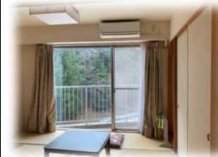
四季折々の眺めが楽しめます