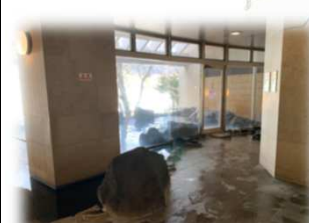
温泉入り放題!癒されます