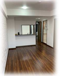
南面リビング♪陽当り良好!