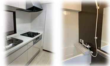
水回りすべて新品です☆