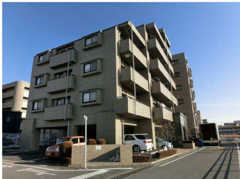
☆昭和小・星が丘中