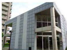
コミュニティプラザ