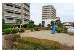
敷地内の提供公園