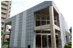
コミュニティープラザ