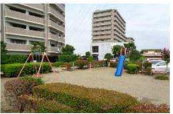
敷地内の提供公園