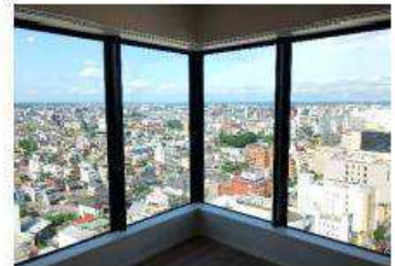
リビングからの眺望