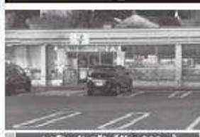
セブンイレブン【約1,800m】