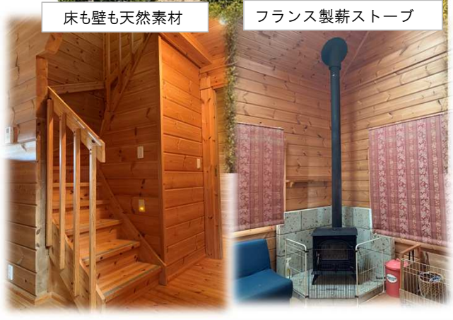
床も壁も天然素材